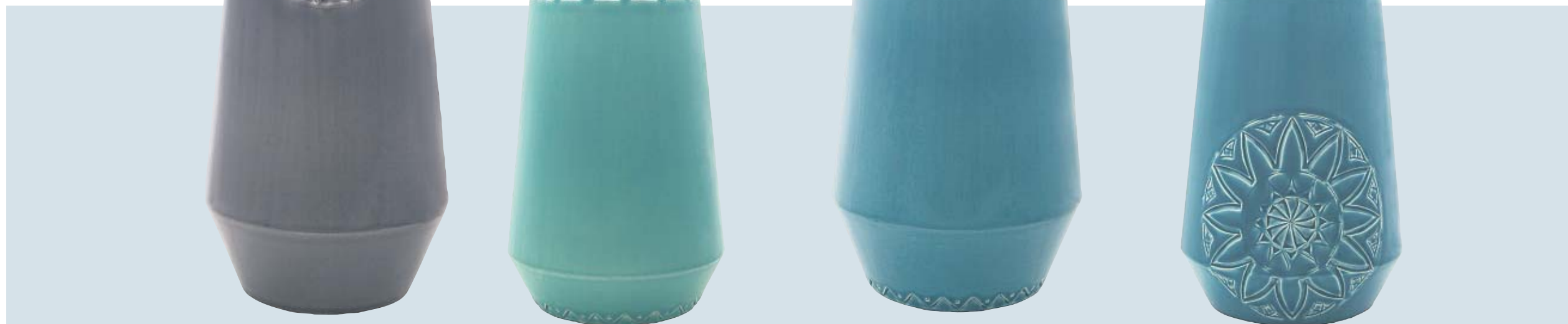
Samen met vakmensen bedenken de zussen nieuwe technieken.